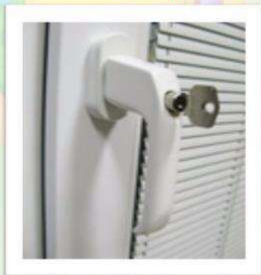
Ручка с ключом