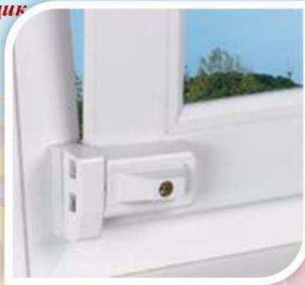
Блокировщик с кнопкой