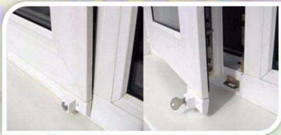
Замок блокировщик с ключом

Можно воспользоваться специальными замками блокираторами, которые предлагают установщики пластиковых окон.